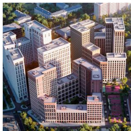
ЖК «Серебряный фонтан» Москва

Полный перечень объектов смотрите по ссылке: