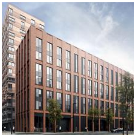
ЖК «ЗИЛАРТ», дом 3, 4, 6 Москва