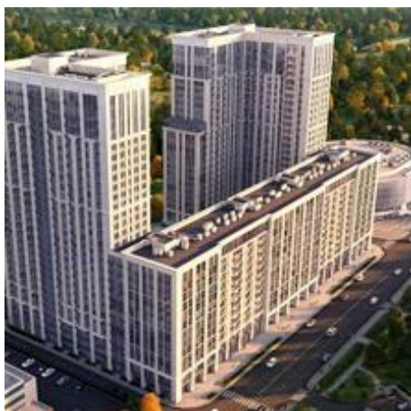
«Match Point» Москва

Компания Электон поставляет огнестойкую кабельную линию «Eltros OKLine» на многие объекты промышленного, гражданского, коммерческого и муниципального строительства. Например: